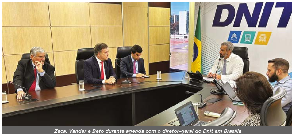
Zeca, Vander e Beto durante agenda com o diretor-geral do Dnit em Brasília

“São obras de fundamental importância para a Rota Bioceânica”, destacou Zeca, que agradeceu os deputados federais Vander Loubet (PT) e Beto Pereira (PSDB) por terem intermediado a agenda no Departamento.