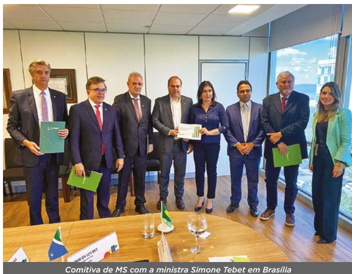
Comitiva de MS com a ministra Simone Tebet em Brasília