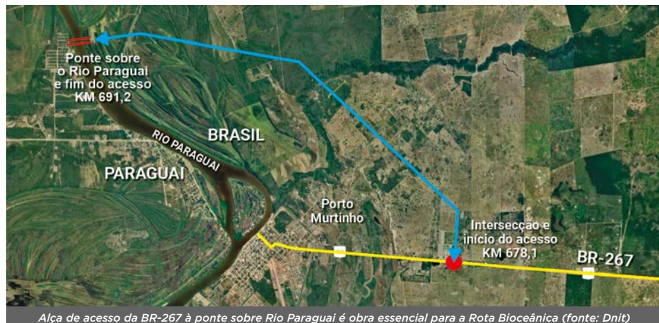
Alça de acesso da BR-267 à ponte sobre Rio Paraguai é obra essencial para a Rota Bioceânica